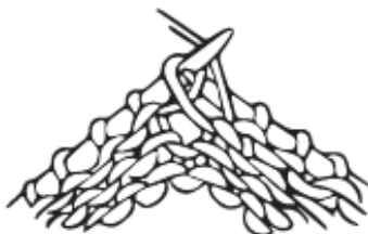
Illustrasjon 3: Øk før merket fra vrangen (strikkes vr)