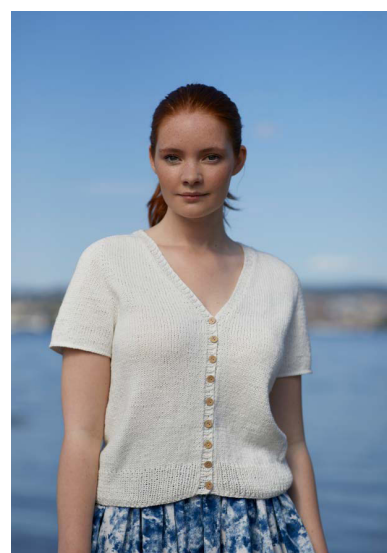
346-11 Sommerbris knappetopp