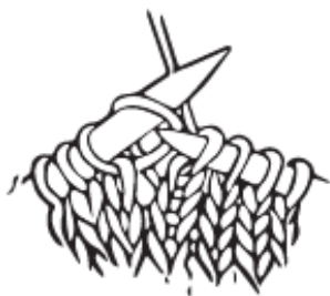
Illustrasjon 1: Øk mot høyre (strikkes r)